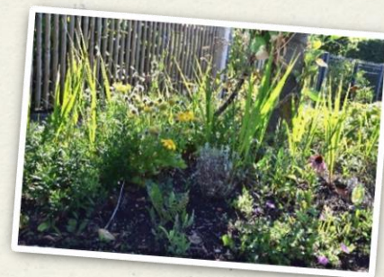
Patenbaum von Gerd Holms mit beplanzter Baumscheibe